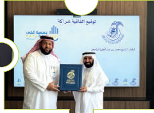
اتفاقية مؤسسة محمد بن عبدالعزيز الراجحي الخيرية