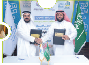
اتفاقية كفي والواجهات الغربية للمقاولات