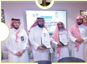
اتفاقية كفي وحمليتي قريش وأذان