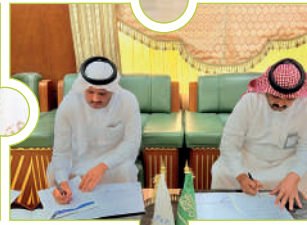
اتفاقية كفي وبلدية القنفذة