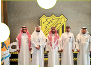
اتفاقية كفي ونادي الاتحاد