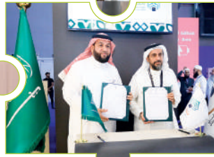
اتفاقية كفي والمجلس التنسيقي متحد