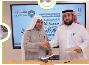
اتفاقية كفي وجمعية حفاوة